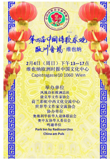
维也纳 春晚《华诗选集》(草) 2018 .1.

(上照) 从左至右依次为：欧洲时报社长王敢，奥中友协华人委员会主席蒋可良、来自荷兰的池莲子女士、奥中友协华人委员会名誉主席张维庆、奥中友协华人委员会名誉主席林云龙、联合国工业发展组织南南及三方合作高级协调员龚维希博士，他们赞助了本次诗歌春晚的活动。