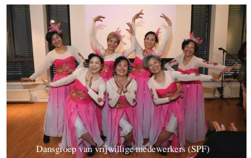
Dansgroep van vrijwillige medewerkers (SPF)